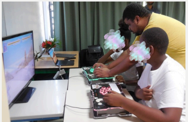
TEEYANDEE pr sente son jeu aux  l ves

Il a m me cr e un jeu vid o inspir  de La Plan te TAKOO . C'est un jeu payant, et pour le moment il n'est pas encore disponible sur PlayStore. Il a pr sent  son jeu aux  l ves qui ont m me pu le tester !