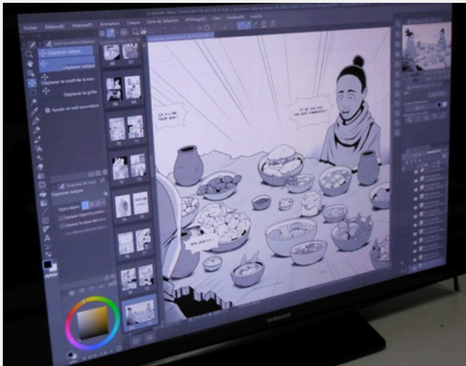
TEEYANDEE pr sente ses techniques de dessin

TEEYANDEE est l'auteur qui a cr e les livres La Plan te TAKOO , il est aussi l'illustrateur. Ses livres parlent d'action et d'aventures. Ce sont des mangas.